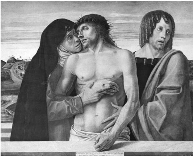
Giovanni Bellini, Pietà (um 1460)