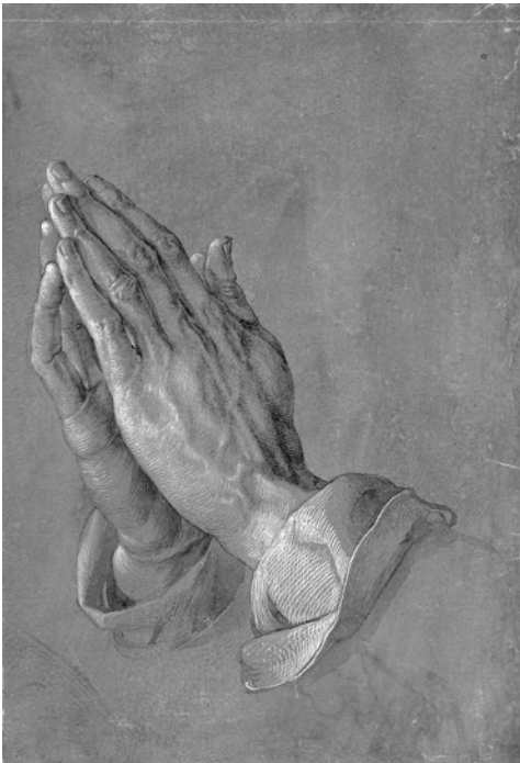
Albrecht Dürer, Betende Hände (ca. 1508)

Schmerz und Trauer, der Umgang mit Schuld und die Hoffnung auf eine bessere Zukunft: Es sind überzeitliche Themen, die sich durch das Programm des heutigen Abends ziehen. Und so wirkt Domenico Scarlattis 300 Jahre altes Stabat Mater bis heute ebenso eindringlich wie das Miserere mei von Nana Forte, das Peter Dijkstra 2023 mit dem Chor des Bayerischen Rundfunks aus der Taufe gehoben hat.