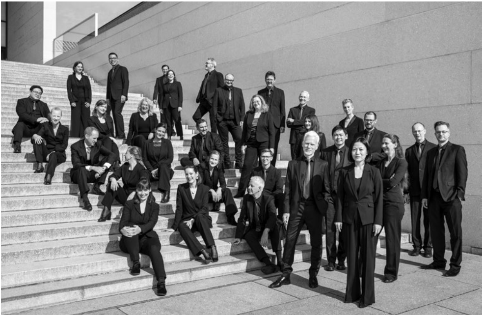
Der RIAS Kammerchor Berlin