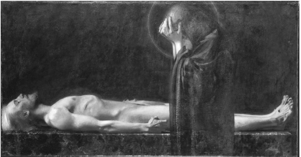
Franz von Stuck, Pietà (1891). In dieser spätromantischen Interpretation der Szene steht die Verzweiflung der Maria ganz im Vordergrund des Gemäldes.

„Wenn es der Kunst gelingt, in uns die Fähigkeit zu echter Verbundenheit zu erwecken“, schreibt Frank Martin in einem Aufsatz, „wenn sie uns durch ihre Schönheit von unserer ewigen Einsamkeit befreit, dann spielt sie die Rolle, die ihr in der heutigen Gesellschaft zukommt.“